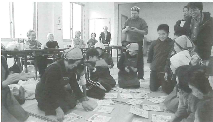
地域ふれあい交流会(藤代地区)

急速に進む少子高齢社会への対応と地域福祉・在宅福祉活動推進の中核的役割を果たすため、市内各地区に 地区社会福祉協議会 があります。