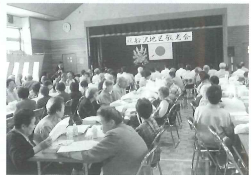
地区社協主催による敬老大会(船沢地区)

3 前項第1号オに規定する一般会費(たすけあい会費)は、岩木支部及び相馬支部については、当分の間一世帯当たり1,000円とする。