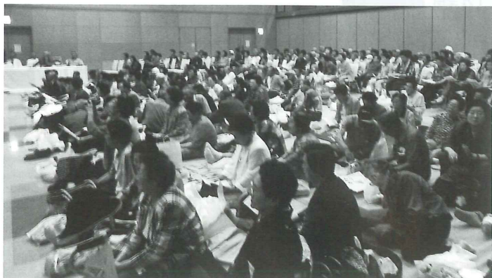
地区社協主催による敬老大会(岩木地区)

急速に進む少子高齢社会への対応と地域福祉・在宅福祉活動推進の中核的役割を果たすため、市内各地区に 地区社会福祉協議会 があります。