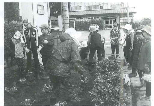
地域ふれあい交流会(堀越地区)

3 前項第1号オに規定する一般会費(たすけあい会費)は、岩木支部及び相馬支部については、当分の間一世帯当たり1,000円とする。