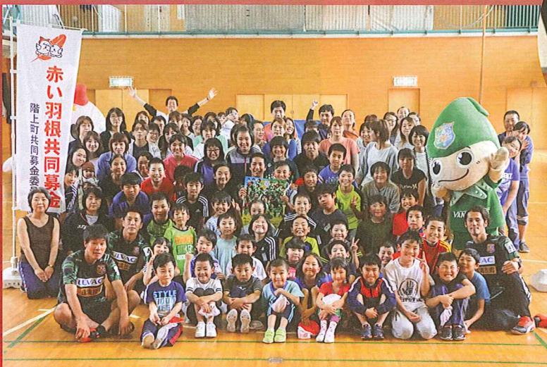
階上町立道仏小学校のみなさん