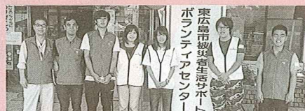
東広島市被災者生活サポートボランティアセンター 広島大学学生ボランティア

大規模災害が起こった際の備えとして、募金額の一部を「災害等準備金」として積み立てています。この準備金は災害ボランティアセンターの設置・運営や、被災した方々への支援に役立てられます。 ※東日本大震災・熊本地震・平成30年7月豪雨災害の災害ボランティア支援にも役立てられています。