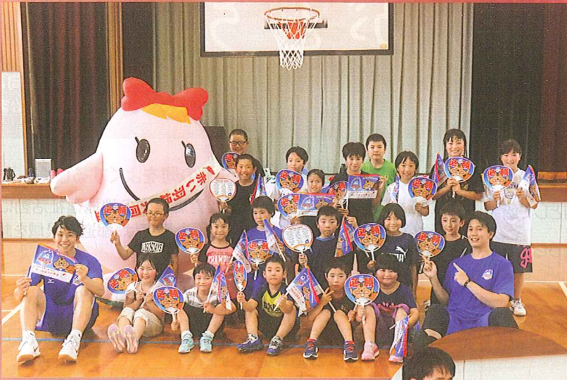
田子町立上郷小学校のみなさん

あなたの「募金」が だれかの「ありがとう」につながっています たくさんのお礼があふれる未来へ