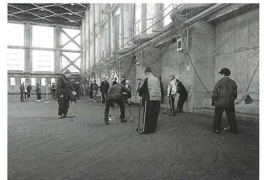
ふれあい高齢者グラウンドゴルフ親善大会

3 前項第1号オに規定する一般会費(たすけあい会費)は、岩木支部及び相馬支部については、当分の間一世帯当たり1,000円とする。