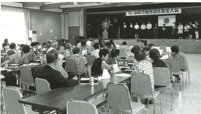
地区社協主催による敬老大会(相馬地区)

急速に進む少子高齢社会への対応と地域福祉・在宅福祉活動推進の中核的役割を果たすため、市内各地区に 地区社会福祉協議会 があります。