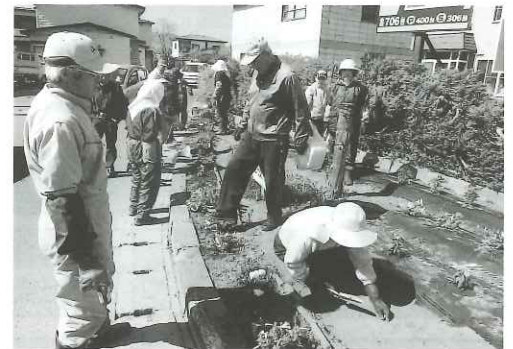
地域ふれあい交流会(堀越地区)

3 前項第1号オに規定する一般会費(たすけあい会費)は、岩木支部及び相馬支部については、当分の間一世帯当たり1,000円とする。