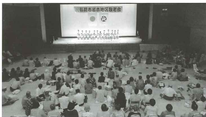
地区社協主催による敬老大会(岩木地区)

急速に進む少子高齢社会への対応と地域福祉・在宅福祉活動推進の中核的役割を果たすため、市内各地区に 地区社会福祉協議会 があります。