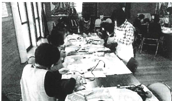
地域ふれあい交流会(文京地区)

急速に進む少子高齢社会への対応と地域福祉・在宅福祉活動推進の中核的役割を果たすため、市内各地区に 地区社会福祉協議会 があります。