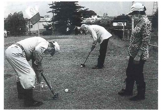
地域ふれあい交流会(清水地区)

3 前項第1号オに規定する一般会費(たすけあい会費)は、岩木支部及び相馬支部については、当分の間一世帯当たり1,000円とする。