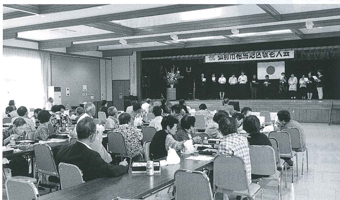
敬老大会(相馬地区)

急速に進む少子高齢社会への対応と地域福祉・在宅福祉活動推進の中核的役割を果たすため、市内各地区に 地区社会福祉協議会 があります。