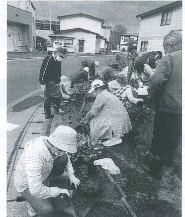
地域ふれあい交流会(掘越地区)

3 前項第1号オに規定する一般会費(たすけあい会費)は、岩木支部及び相馬支部については、当分の間一世帯当たり1,000円とする。