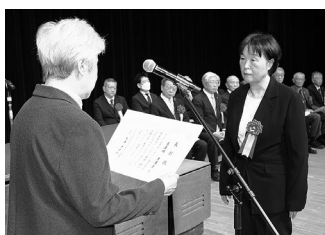
弘前市民生委員児童委員 協議会会長表彰