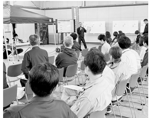
熱心に学ばれる参加者

17日(金)は、シナリオを用いたセンター開設までの訓練や、開設に係る備品設置の訓練、令和7年1月豪雪時の災害ボランティアセンターの活動報告を行いました。18日(土)は、アプリを活用しての災害ボランティア受付や登録、ニーズ調査や管理の方法についての訓練を行いました。